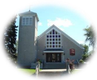
PRECIOUS BLOOD / PRÉCIEUX-SANG Glen Walter