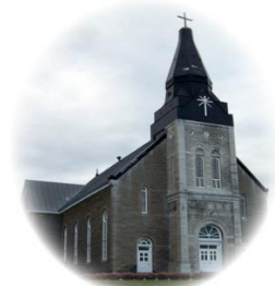
ST MARGARET OF SCOTLAND / STE-MARGUERITE D'ÉCOSSE Glen Nevis