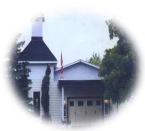
SAINT JOSEPH / SAINT-JOSEPH Lancaster